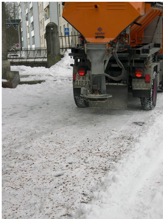
Photo 4 - Epandage à la machine