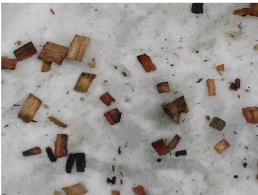
Photo 1 - Copeaux de bois sur surface enneigée

Le bois est généralement un bois tendre (épicéa, peuplier, bouleau, etc.). Le copeau de bois tendre a en effet un meilleur comportement et une meilleure tenue sous l'action de sollicitations importantes comme les roues de véhicules.