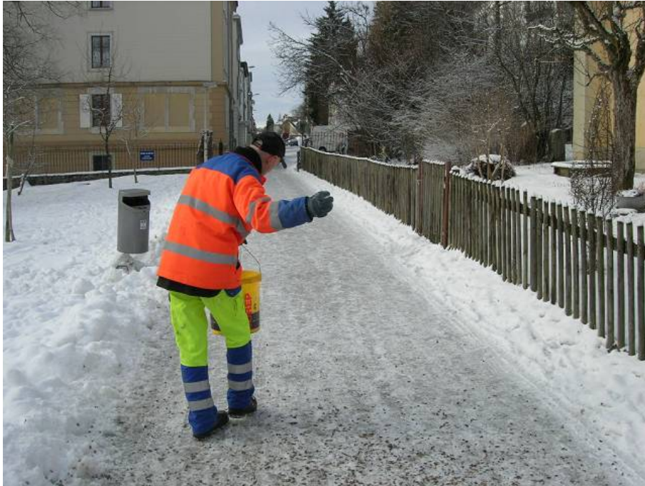
Photo 3 - Epandage à la main