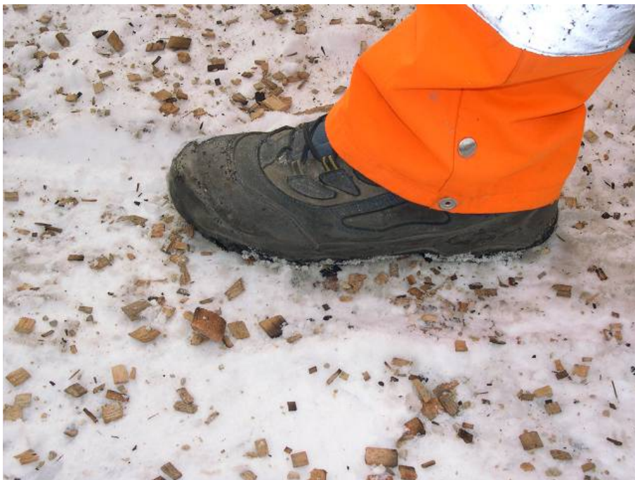
Photo 2 - Aspect d'une surface avec un dosage en copeaux correct

Le dosage requis est d'environ 150 g/m 2 , soit 15 à 20 copeaux sous l'empreinte d'une chaussure (photo 2). Cette quantité garantit ainsi une excellente adhérence et assure au piéton une sécurité supérieure, voire égale à celle offerte par un gravillonnage.